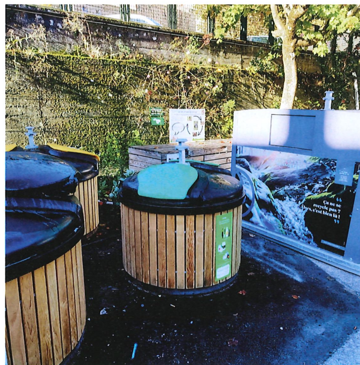
Imprimé par Domcom. Ne pas jeter sur la voie publique.

Les déchets alimentaires doivent être déposés dans les composteurs mis à votre disposition (Square du 8 mai, Place Bancel, Place derrière Mairie, Ecole).