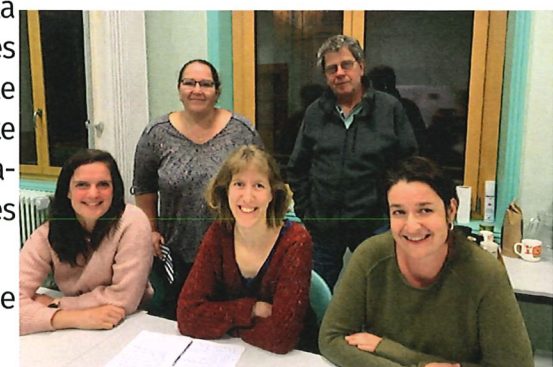
L'équipe du Pôle Santé

Nous espérons également qu'il sera une source d'attractivité pour les habitants des villages voisins et apportera ainsi une clientèle supplémentaire pour nos commerces.