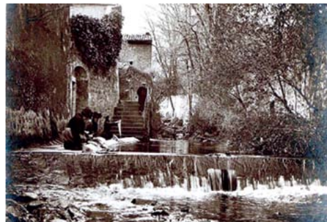
Archives Patrimoine Pirailon