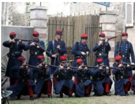
Quand les hommes veulent jouer aux petits soldats...