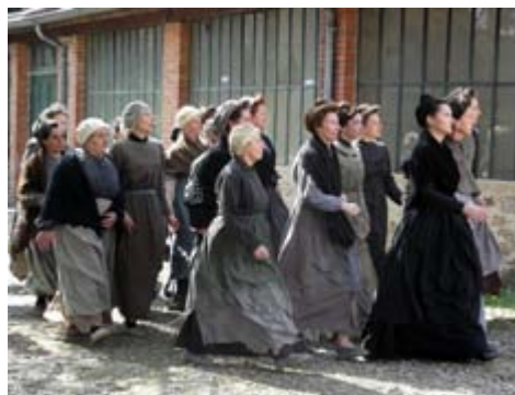
les femmes en colère se mobilisent...