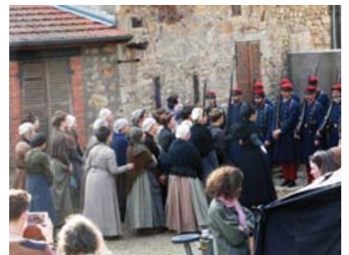
... pour leur passer un savon ! (ce n'est pas le vrai scénario...)