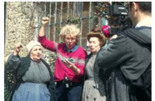
« Debout les damnés de la terre, etc. »