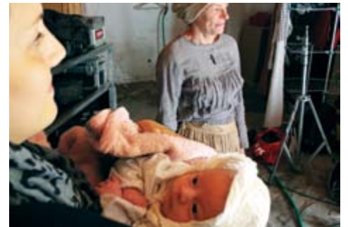
La plus jeune et la plus belle actrice du film.