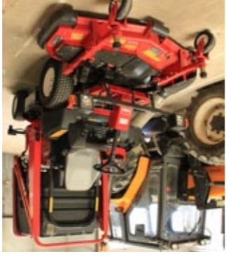
Tondeuse auto-portée 4x4