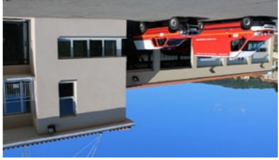
La caserne des pompiers