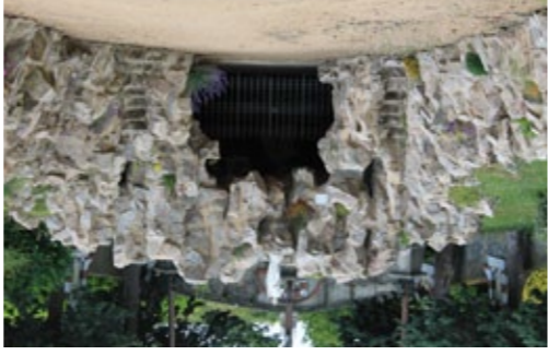
La grotte du Calvaire

Eau Potable et Assainissement Collectif : les rapports annuels, présentés par le Maire, sur les prix et la qualité des services sont approuvés : ils sont consultables en Mairie.