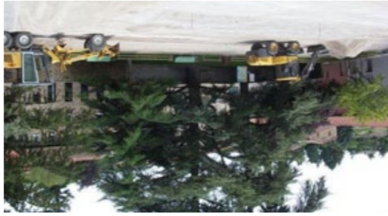
La Place Bancal