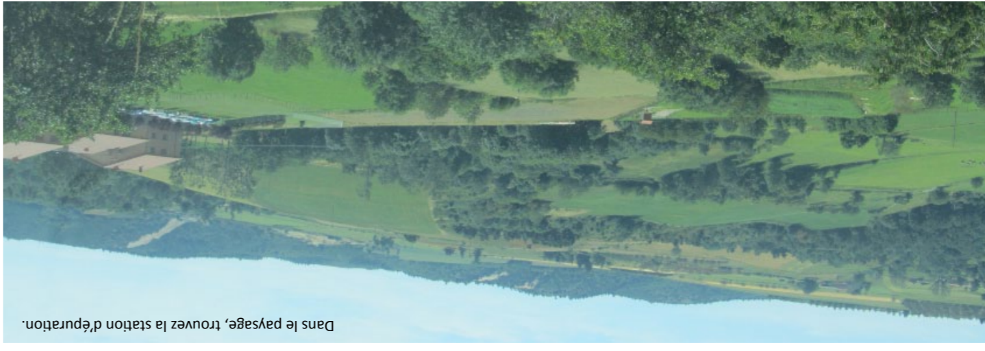
Dans le paysage, trouvez la station d'épuration.